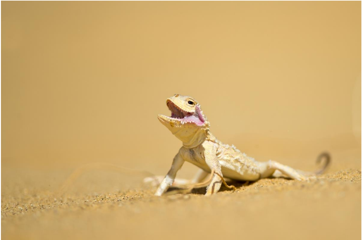
Фото 3. Ушастая круглоголовка.