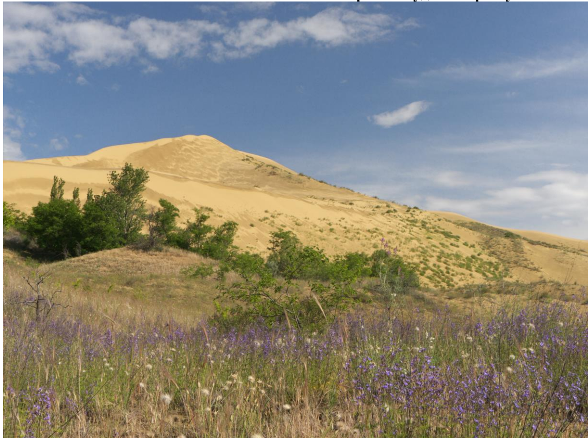
Фото 1. Песчаный массив Сарыкум.