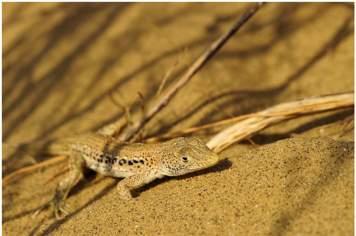
Фото 4. Быстрая ящурка.